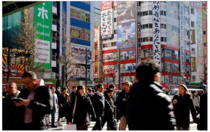
People cross a street in the Akihabara shopping district in Tokyo, Japan, January 10, 2017. The Tokyo metro area GDP PPP is $1.6 trillion, about the same as Spain or Canada.

DESIGN / TRANSPORTATION / ENVIRONMENT / EQUITY / LIFE