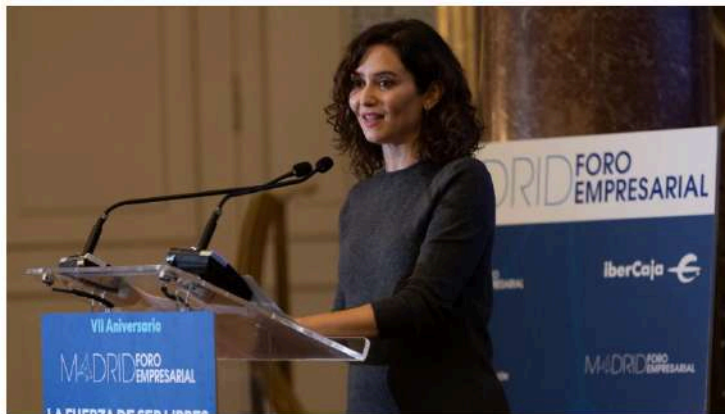
La presidenta de la Comunidad de Madrid, Isabel Díaz Ayuso, en el VII aniversario de Madrid Foro Empresarial.