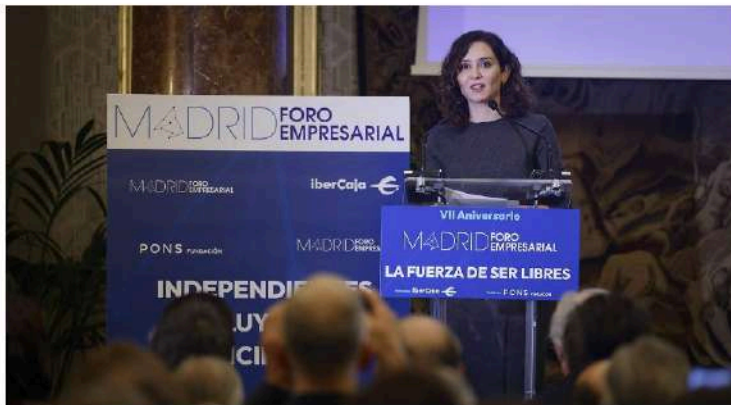
La presidenta de la Comunidad de Madrid, Isabel Díaz Ayuso.