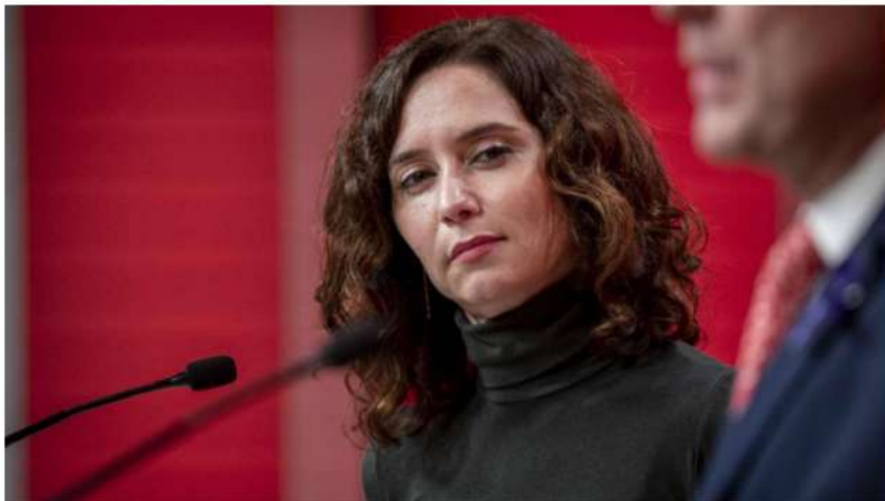
La presidenta de la Comunidad de Madrid, Isabel Díaz Ayuso.

Isabel Díaz Ayuso, presidenta de la Comunidad de Madrid, ha vuelto a salir en defensa de los que más tienen. Así lo ha hecho en el círculo de empresarios 'La fuerza de ser libres', organizado por Madrid Foro Empresarial, donde ha asegurado que su Gobierno continuará bajando impuestos en pleno derrumbe de los servicios públicos madrileños.