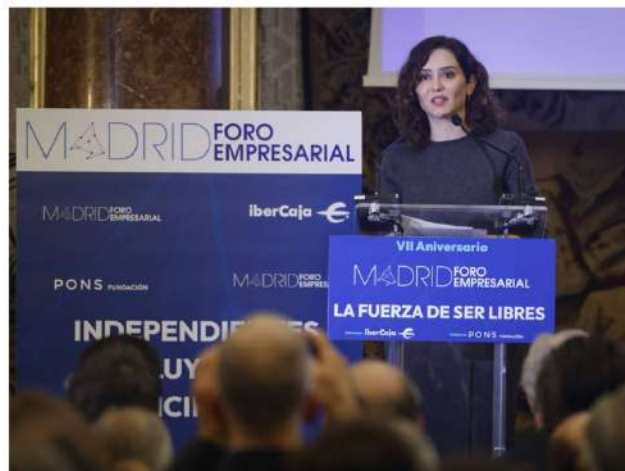
Isabel Díaz Ayuso, durante su intervención en el acto de Madrid Foro Empresarial.

La presidenta de la Comunidad se ha mostrado a favor de esta infraestructura en un encuentro con empresarios, donde ha atacado a Sánchez por sus "decisiones políticas terribles" para la inversión, como el impuesto a los ricos