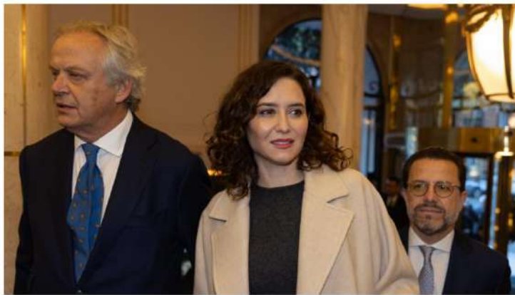
La presidenta de la Comunidad de Madrid, Isabel Díaz Ayuso, en el VII aniversario de Madrid Foro Empresarial.