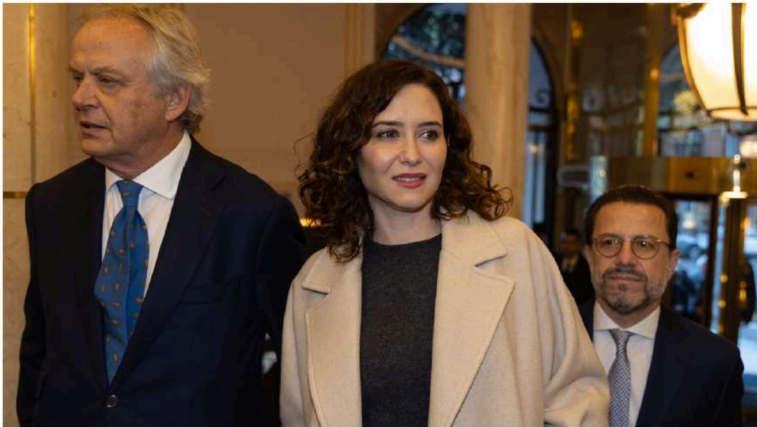
Ayuso apela a la "sensatez" para aprobar los Presupuestos regionales

En declaraciones a los periodistas, en el VII aniversario de Madrid Foro Empresarial celebrado en el Hotel Wellington, ha indicado que esta semana se sabrá más y que ahora mismo desde las distintas consejerías, pero especialmente desde la de Economía, Empleo y Hacienda, están hablando con Vox.