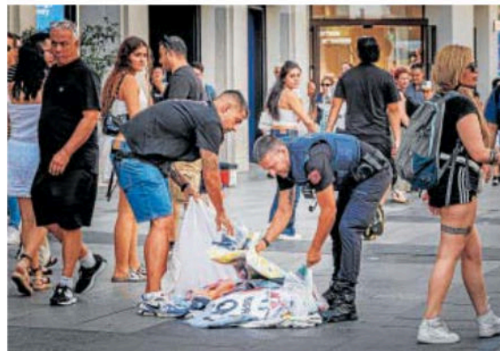
Agentes de la Policía Municipal requisan material en Gran Vía

El material es de mediana calidad y los escudos mal bordados delatan falsedad, pero no es tan evidente como en el resto de productos. Por ejemplo, las gafas -a 10 euros cada una, con posibilidad de regatear hasta los 7- o los bolsos -25 euros, que pueden bajar a 20- son claramente copias, y por ello, son menos populares entre los transeúntes, pero claro, todavía cuen-